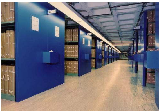
Waar te beginnen?