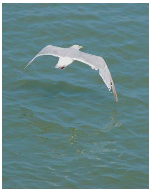
Gemaakt met de D50 met een 180mm (crop 270mm) f5,6

De meeuwentest uit 2005 is een handige test om te zien hoe snel het normaal kan. Als je meerdere van de hierboven genoemde mogelijkheden instelt op je camera, dan gaat het aanmerkelijk sneller.