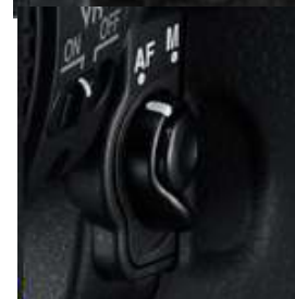
Bv. D7000 + D5

De Nikon D40 (x) D60, D3000, D3100, D3400, D5000, D5100, D5500 hebben geen keuzeschakelaar meer op de body, naast de objectiefvatting.