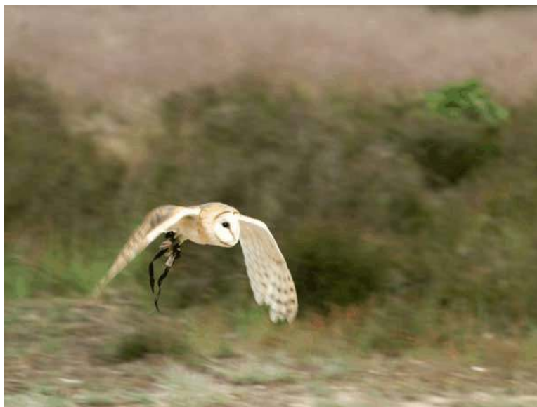
Opname met een D200 en een AF 180 f2,8 NIKKOR. Sluiterijd 1/180, diafragma f7,1. Opname stand CH, AF stand Continue, 7 scherpstelzones. Dit was de enige opname (uit een serie an 50) waarbij het onderwerp nog te herkennen is. Maar scherp is wat anders. Anderen die mee deden met de Nikon workshop hadden een D3 en een AF-S objectief van Nikon te leen en bij hen lukten vrijwel alle opnamen.

7. Selecteer zo veel mogelijk AF punten voor de scherpstelling. In de Dynamische (veld) AF stand kun met een D3 of D4 kies je er 9 in plaats van 51. En D5 gaat tot 153 AF punten. En zet dew camera dan ook op de AF-C (high) stand. Een beetje een camera zal dan zelf ook de focustracking (*3D tracking) aan zetten. Daardoor is de AF sneller. En daardoor kun je sneller scherpe foto's maken.